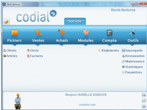
Ecran d'accueil Codial Devis-factures