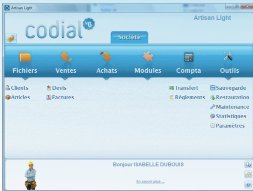
Ecran d'accueil Codial Artisan Light